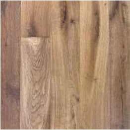
Roble Ancient Tomb